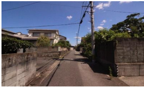
前面道路南西側より撮影