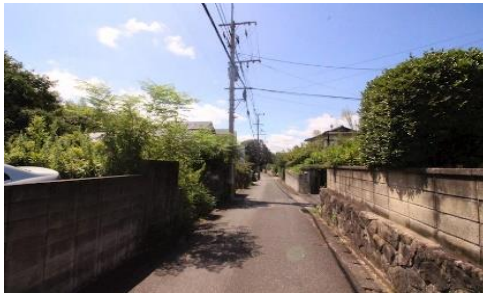
前面道路北東側より撮影