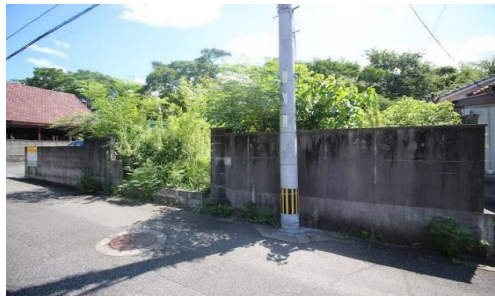
前面道路正面より撮影